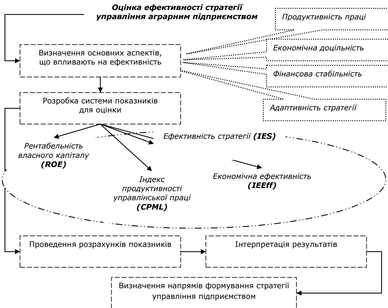
Рисунок 1 – Методика оцінки ефективності стратегії управління аграрним підприємством

Результати розрахунку індексу ефективності стратегії управління досліджуваних аграрних