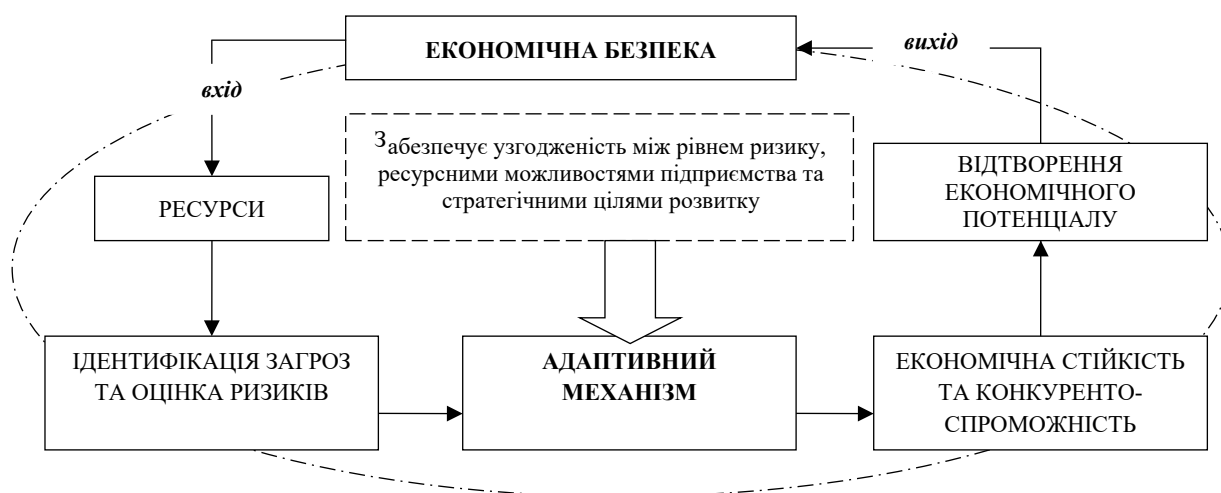
Рисунок 2 – Інфо-логічна схема трансформації підходів до забезпечення економічної безпеки підприємств харчової промисловості