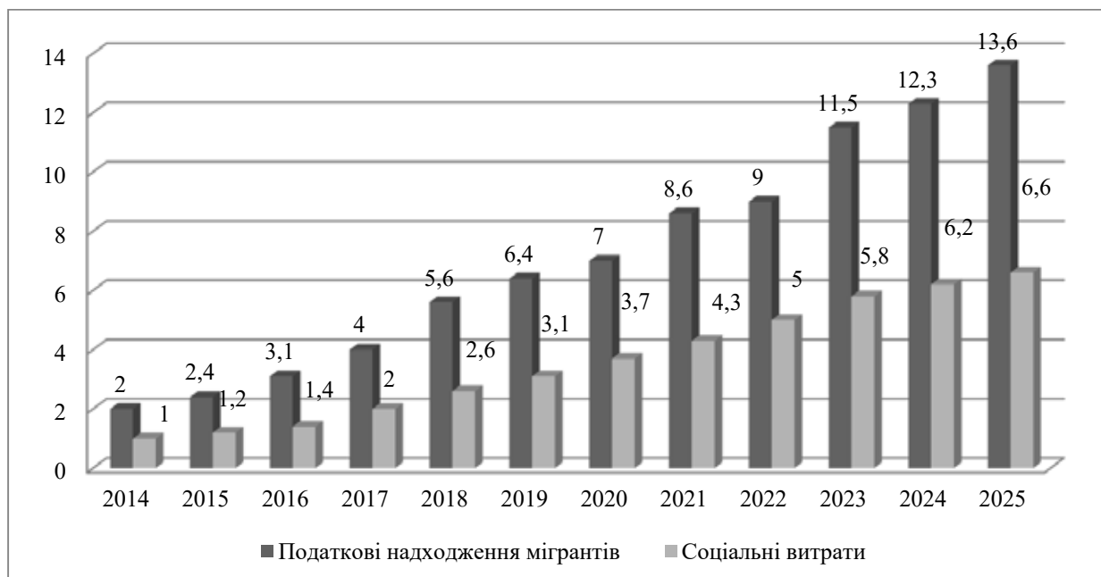
Рисунок 2 – Динаміка впливу трудової міграції на бюджет Польщі за період 2014–2025 рр., у млрд дол. США

Порівняльний аналіз двох діаграм дозволяє зробити узагальнений висновок про асиметричний характер впливу міжнародної трудової міграції на формування державних бюджетів. Якщо для України характерним є поєднання позитивних і негативних ефектів із поступовим посиленням негативних тенденцій у довгостроковій перспективі, то для Польщі міграція