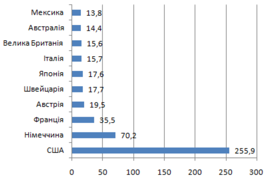
Рисунок 2 – Надходження від велнес-туризму, млрд дол.