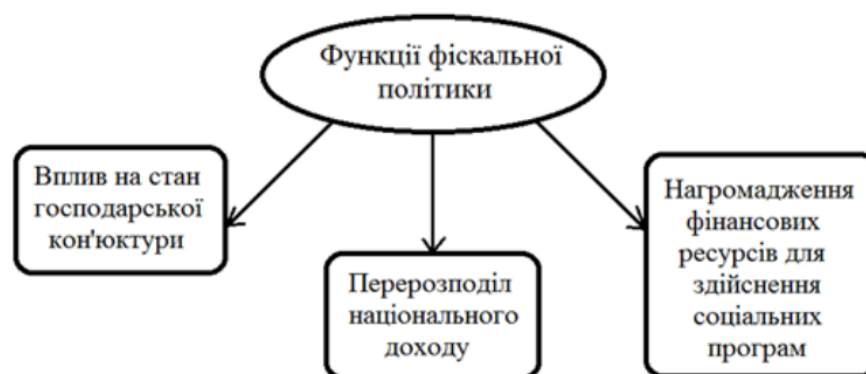
Рисунок 1 – Функції фіскальної політики

Грошово-кредитна політика та банківське регулювання демонструють, що центральний банк може використовувати свої повноваження для здійснення антициклічних дій. У випадку